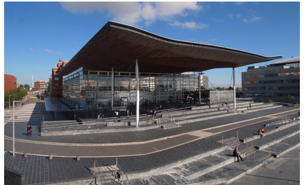
Gwneir newidiadau i'r Ddeddf Coronavirus i sicrhau bod hawliau pobl hŷn yn cael eu diogelu'n well cyn diwedd mis Mawrth

Gallwch chi ddarllen datganiad Llywodraeth Cymru yma: https://llyw.cymru/datganiad-ysgrifenedig-deddf-coronafeirws-2020-atal-dros-dro-rheoliadau-gofal-chymorth-awdurdodau